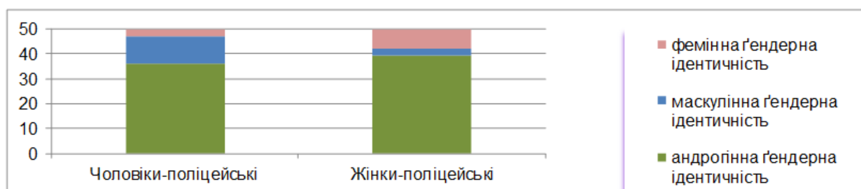
Рис. 2. Представленість ґендерної ідентичності респондентів чоловічої та жіночої статей (у %)

андрогінна, у решти – маскулінна (14 %) або фемінна (10,7 %).