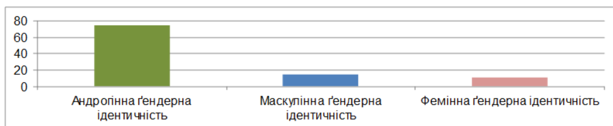
Рис. 1. Представленість ґендерної ідентичності респондентів (у %)

ідентичність (75,3 %, або 113 осіб), менше – маскулінна (14 % – 21 осіб) і фемінна (10,7 % – 16 осіб) ґендерні ідентичності.